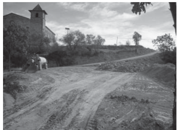
Arranjament del camí del Santuari