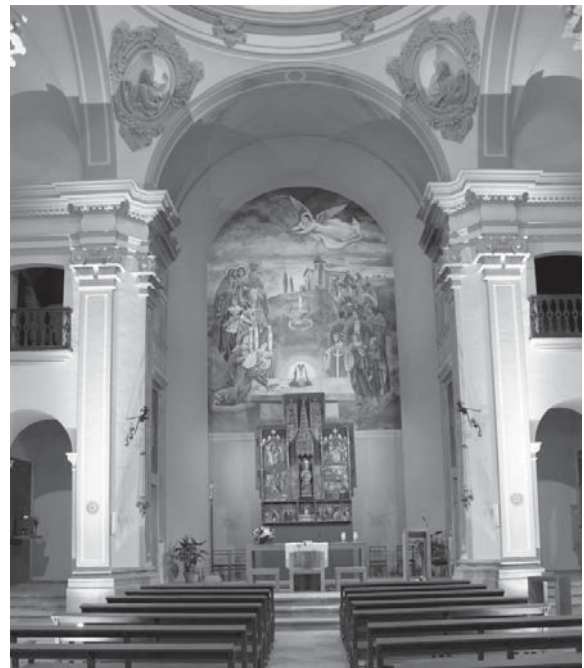
Abans i després de les obres a la parròquia