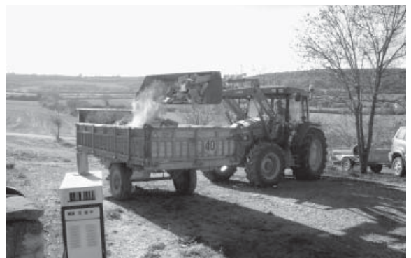
Obres al Santuari de Santa Maria

que se'n duu a Roma els vestigis del prodigi. El papa Sergi IV emet una Butlla, com una certificació del miracle i regala a Ivorra una sèrie de relíquies que són les que es veneren actualment al reliquiari gòtic, en aquesta parròquia de la Vall del Llobregós.