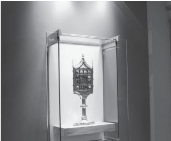
El reliquari gòtic del Sant Dubte