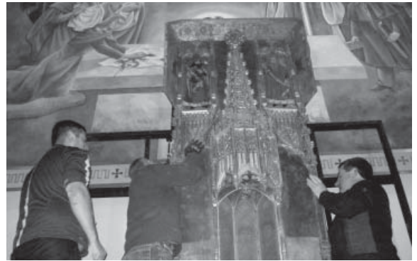
Recuperació del retaule gòtic del Sant Dubte