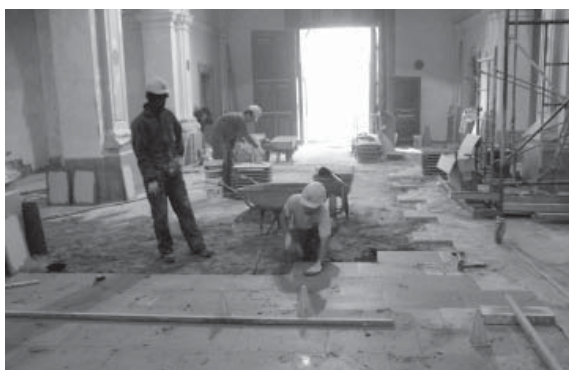
Obres a la parròquia de Sant Cugat