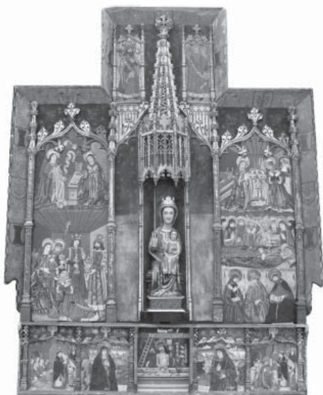
Retaule gòtic recuperat