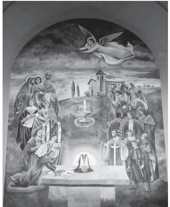
El mural que decora el presbiteri

El diumenge dia 7 de febrer, coincidint amb la Festa Major d'Hivern de la Candelera, s'han inaugurat a Ivorra les obres de rehabilitació de l'església parroquial de Sant Cugat.