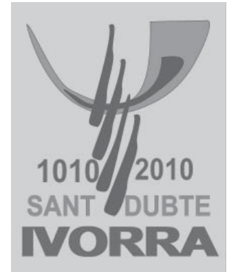
Logotip del Mil·lenari